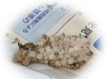
ダンゴムシの卵 オタマジャクシの足 カタツムリの卵